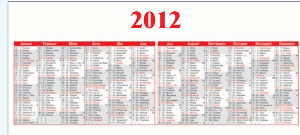
Rückseite: Jahreskalendarium inklusive Namenstage